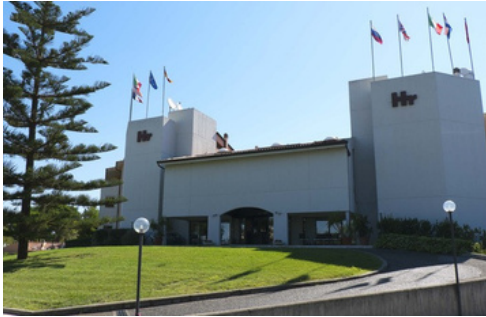
HOTEL HERACLEA POLICORO

SISTEMAZIONE: in bungalow dotati di servizi ed impianto di climatizzazione autonomo, situati all'interno del Campus Naturalistico sito nella riserva naturale del Bosco Pantano di Policoro (MT) in grado di ospitare studenti con sistemazione fino a 6 posti letto e per i docenti in camere singole/doppie a seconda delle varie esigenze.