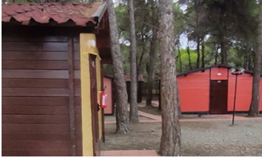
CIRCOLO VELICO LUCANO POLICORO

SISTEMAZIONE: in bungalow dotati di servizi ed impianto di climatizzazione autonomo, situati all'interno del Campus Naturalistico sito nella riserva naturale del Bosco Pantano di Policoro (MT) in grado di ospitare studenti con sistemazione fino a 6 posti letto e per i docenti in camere singole/doppie a seconda delle varie esigenze.