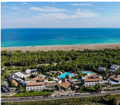
VILLAGGIO GIARDINI D'ORIENTE NOVA SIRI

SISTEMAZIONE: L'Hotel Heraclea è un elegante 4 stelle situato a Policoro Lido, a pochi passi dal mare e immerso nella natura della Riserva del Bosco Pantano. Offre tutti i comfort per un soggiorno rilassante: camere moderne e accoglienti. Per i docenti accompagnatori la sistemazione è in singola o doppia, a seconda delle esigenze